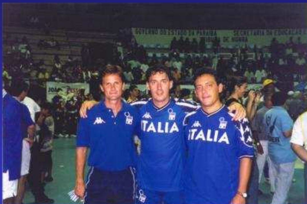
Campionati Mondiali Universitari di Calcio a 5 (JOAO PESSOA Agosto 2000)